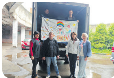
26 мая жители МО Ульяновка и МО Автово отправили очередную машину с гумпомощью в подшефный полк